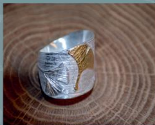
Artur Konnerth, Goldschmied

12. & 13. September 2020 von 10 - 18 Uhr